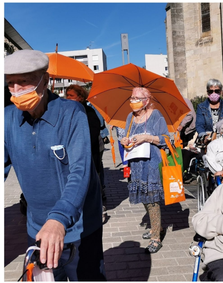
La Mobil'Aînés® : une marche décalée !