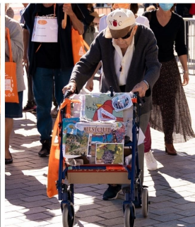
La Mobil'Aînés® : un évènement intergénérationnel bienveillant !